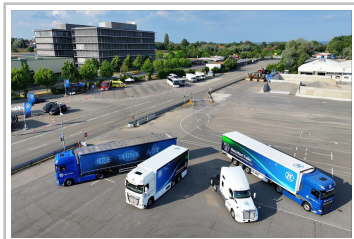
ZF Global Technology Day 2023.