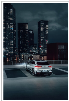
Jaguar I-Pace in Manchester.