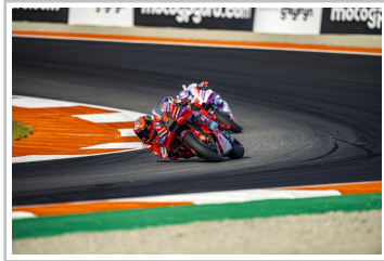
Moto-GP-Weltmeister 2023: Francesco Bagnaia auf Ducati.