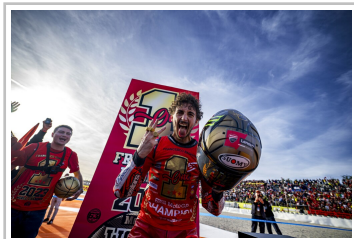
Moto-GP-Weltmeister 2023: Francesco Bagnaia auf Ducati.