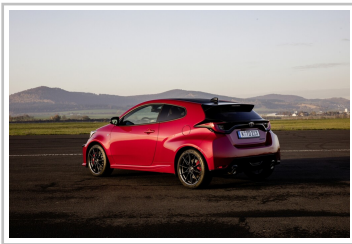
Toyota GR Yaris, WM-Sonderedition.