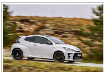
Toyota GR Yaris, WM-Sonderedition.