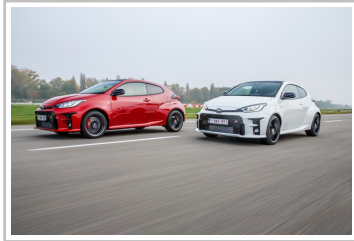
Toyota GR Yaris, WM-Sonderedition.