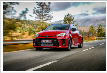
Toyota GR Yaris, WM-Sonderedition.