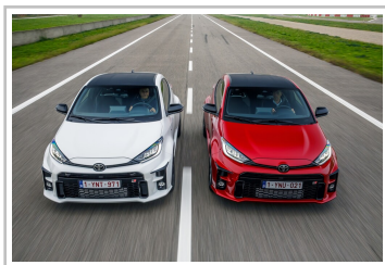
Toyota GR Yaris, WM-Sonderedition.