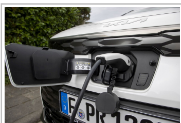
Kia Niro EV.