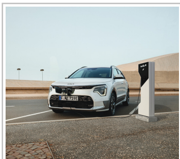
Kia Niro EV.