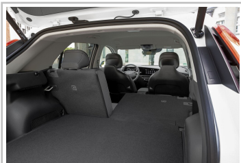
Kia Niro EV.