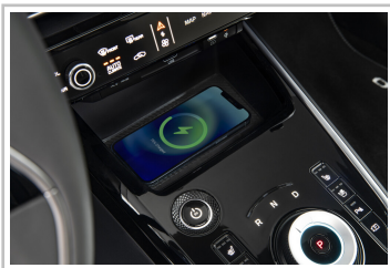
Kia Niro EV.