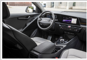
Kia Niro EV.