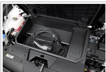
Kia Niro EV.