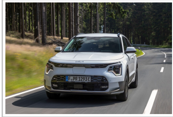
Kia Niro EV.