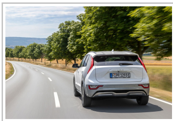
Kia Niro EV.