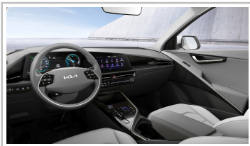
Kia Niro EV.