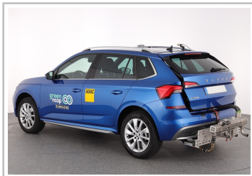
Skoda Kamiq im Green-NCAP-Test.