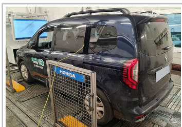
Renault Kangoo E-Tech Electric im Green-NCAP-Test.