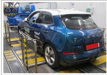
GWM Ora 03 (vormals Ora Funky Cat) im Green-NCAP-Test.