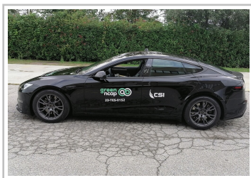
Tesla Model S im Green-NCAP-Test.