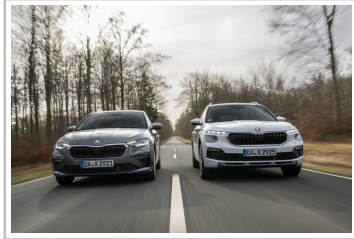
Skoda Scala (I.) und Kamiq.