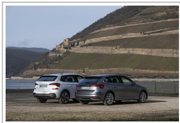
Skoda Kamiq (I.) und Scala.