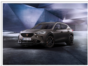
Cupra Formentor VZ5, Final Edition „Century“.