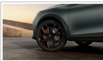
Cupra Formentor VZ5, Final Edition „Enceladus“.