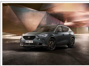
Cupra Formentor VZ5, Final Edition „Enceladus“.