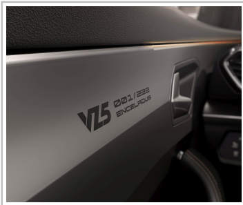
Cupra Formentor VZ5, Final Edition „Enceladus“.