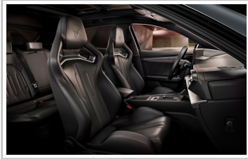
Cupra Formentor VZ5, Final Edition „Enceladus“.