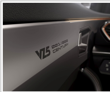
Cupra Formentor VZ5, Final Edition „Century“.