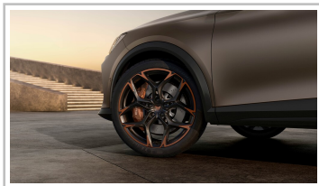
Cupra Formentor VZ5, Final Edition „Century“.