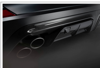
Cupra Formentor VZ5, Final Edition „Enceladus“.