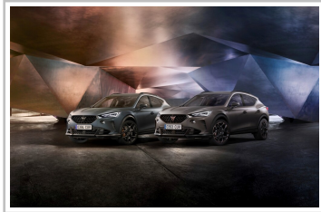
Cupra Formentor VZ5, Final Edition „Enceladus“ (l) und „Century“.