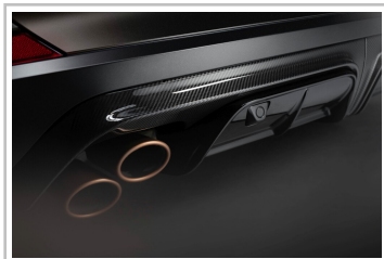
Cupra Formentor VZ5, Final Edition „Century“.