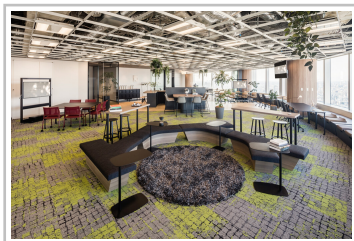
Mazda Innovation Space in Tokio.