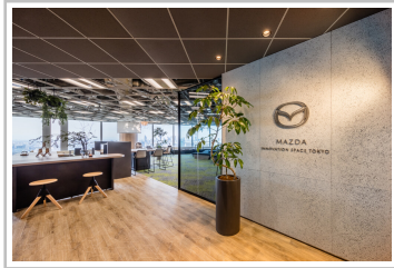
Mazda Innovation Space in Tokio.