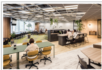
Mazda Innovation Space in Tokio.