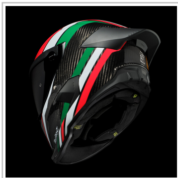
Ruroc Atlas 4.0 Flag Drop „Tricolore“.