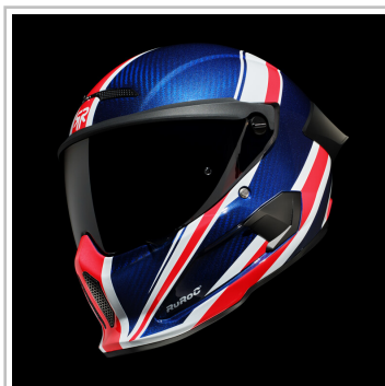
Ruroc Atlas 4.0 Flag Drop „Union Jack“.