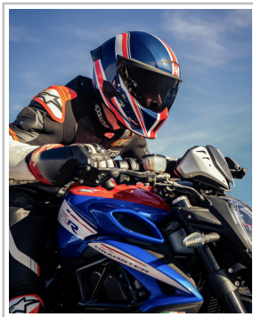
Ruroc Atlas 4.0 Flag Drop „Union Jack“.