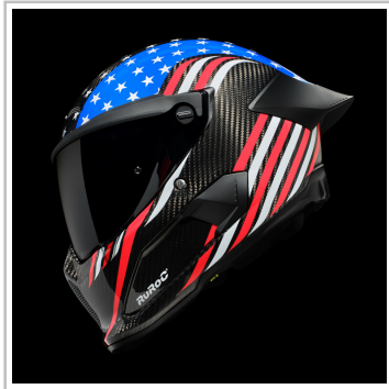
Ruroc Atlas 4.0 Flag Drop „Stars and Stripes“.