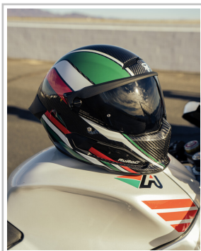
Ruroc Atlas 4.0 Flag Drop „Tricolore“.