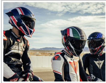
Ruroc Atlas 4.0 Flag Drop.