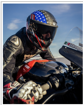
Ruroc Atlas 4.0 Flag Drop „Stars and Stripes“.