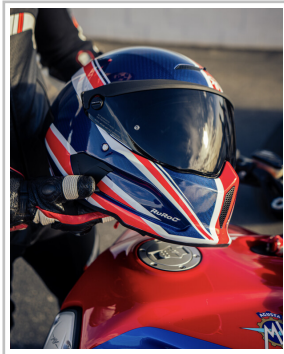
Ruroc Atlas 4.0 Flag Drop „Union Jack“.