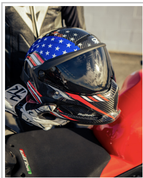
Ruroc Atlas 4.0 Flag Drop „Stars and Stripes“.