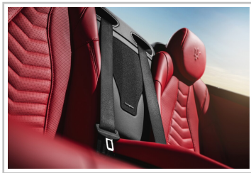
Maserati Gran Cabrio Trofeo.