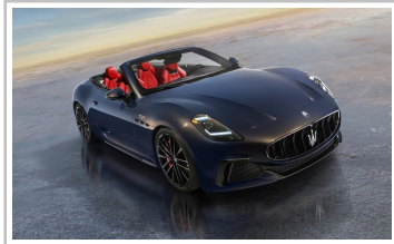
Maserati Gran Cabrio Trofeo.