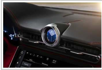
Maserati Gran Cabrio Trofeo.