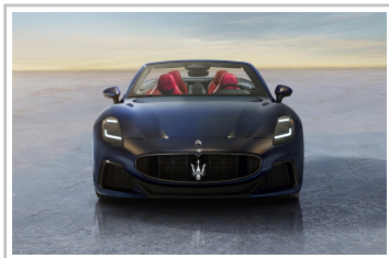
Maserati Gran Cabrio Trofeo.