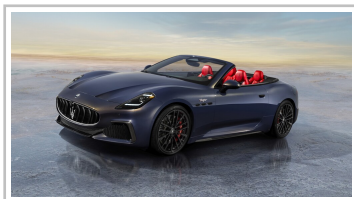
Maserati Gran Cabrio Trofeo.