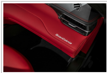
Maserati Gran Cabrio Trofeo.