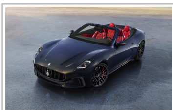
Maserati Gran Cabrio Trofeo.