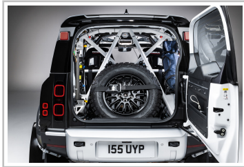
Wettbewerbsfahrzeug der „Defender Rally Series“.