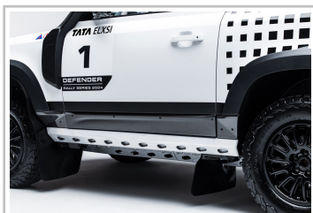
Wettbewerbsfahrzeug der „Defender Rally Series“.