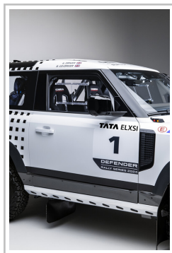
Wettbewerbsfahrzeug der „Defender Rally Series“.