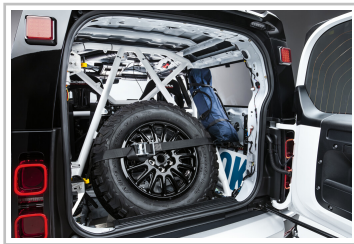
Wettbewerbsfahrzeug der „Defender Rally Series“.