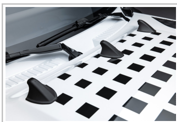
Wettbewerbsfahrzeug der „Defender Rally Series“.