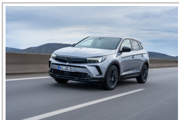
Opel Grandland Hybrid.