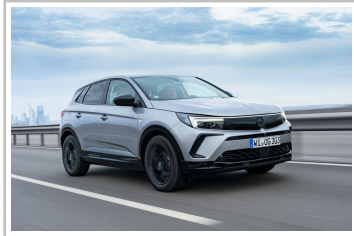
Opel Grandland Hybrid.