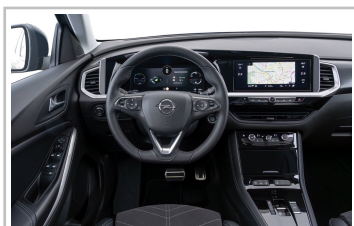
Opel Grandland Hybrid.