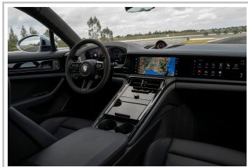
Porsche Panamera Turbo E-Hybrid.