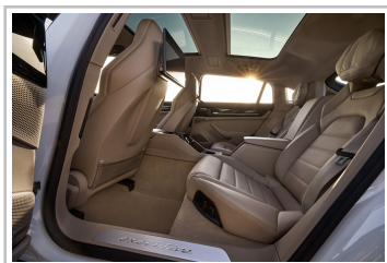
Porsche Panamera 4 E-Hybrid Executive.