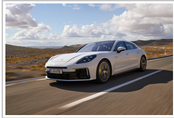
Porsche Panamera 4 E-Hybrid Executive.