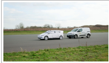
Citroën Berlingo im Euro-NCAP-Test.