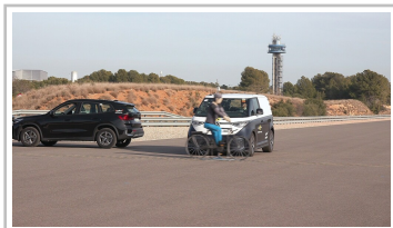
VW ID Buzz Cargo im Euro-NCAP-Test.