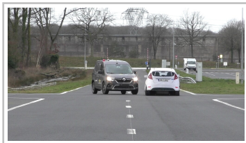
Renault Kangoo im Euro-NCAP-Test.