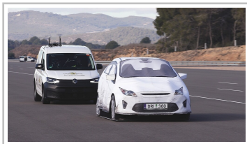
VW Caddy im Euro-NCAP-Test.