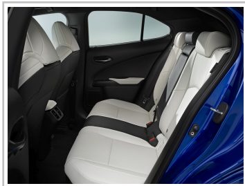
Lexus UX 300h.