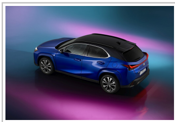
Lexus UX 300h.