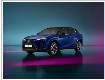
Lexus UX 300h.