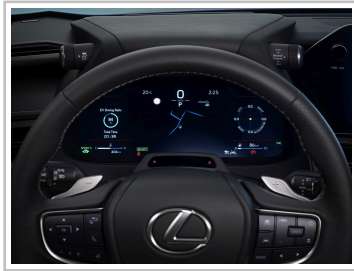
Lexus UX 300h.