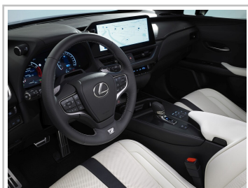
Lexus UX 300h.