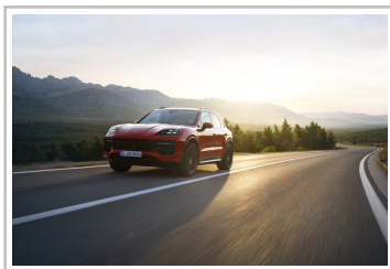
Porsche Cayenne GTS.