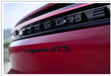
Porsche Cayenne GTS.