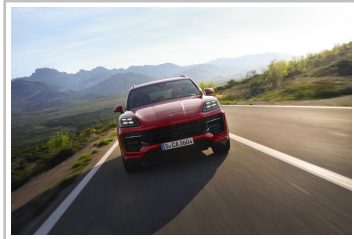
Porsche Cayenne GTS.