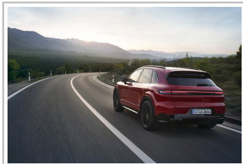
Porsche Cayenne GTS.