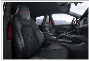
Porsche Cayenne GTS.