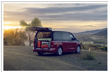
VW Multivan mit Gute-Nacht-Paket.