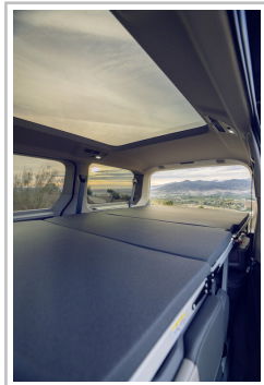
VW Multivan mit Gute-Nacht-Paket.