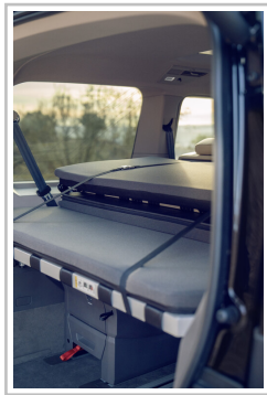
VW Multivan mit Gute-Nacht-Paket.