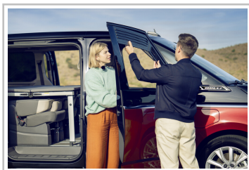
VW Multivan mit Gute-Nacht-Paket.