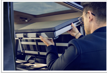
VW Multivan mit Gute-Nacht-Paket.