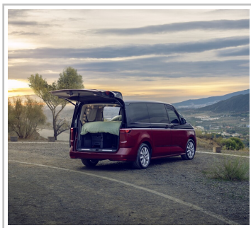
VW Multivan mit Gute-Nacht-Paket.