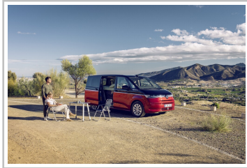
VW Multivan mit Gute-Nacht-Paket.