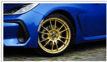
Subaru BRZ, Sondermodell „Final Edition“.