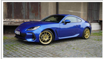
Subaru BRZ, Sondermodell „Final Edition“.