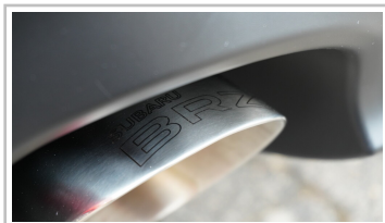
Subaru BRZ, Sondermodell „Final Edition“.