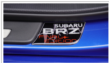
Subaru BRZ, Sondermodell „Final Edition“.