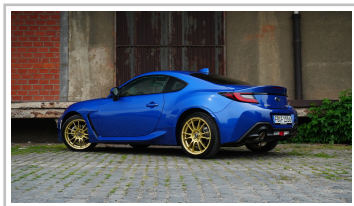
Subaru BRZ, Sondermodell „Final Edition“.