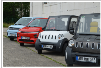
Ari 802, 902 und Soleno (von rechts).