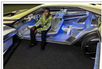
Peugeot-Studie Inception Concept x 3Paradis.