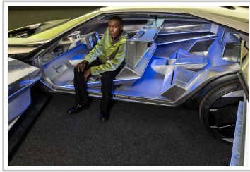
Peugeot-Studie Inception Concept x 3Paradis.