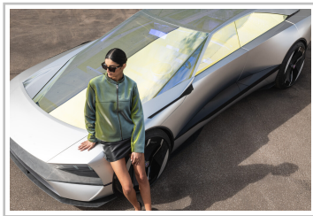
Peugeot-Studie Inception Concept x 3Paradis.