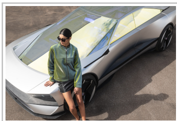
Peugeot-Studie Inception Concept x 3Paradis.