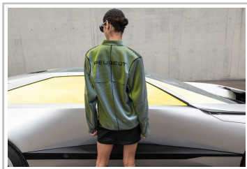
Peugeot-Studie Inception Concept x 3Paradis.