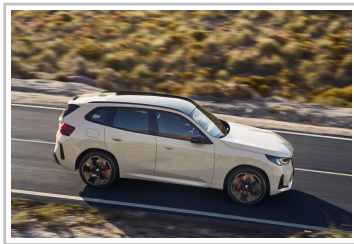
BMW X3 M50 x-Drive.