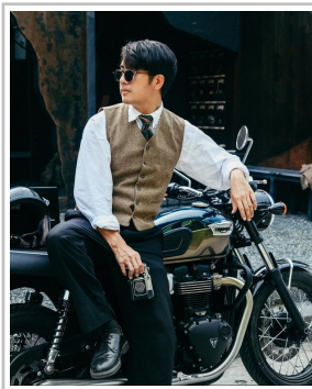
Distinguished Gentleman's Ride 2024.