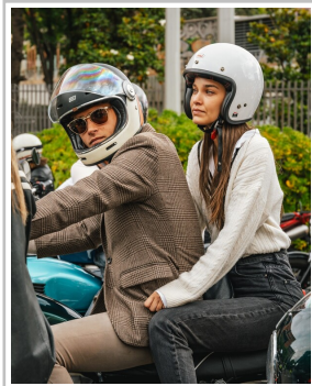
Distinguished Gentleman's Ride 2024.