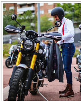
Distinguished Gentleman's Ride 2024.