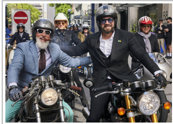
Distinguished Gentleman's Ride 2024.