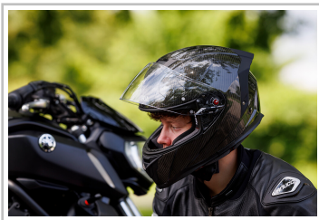
Nishua NRX-3 Carbon.