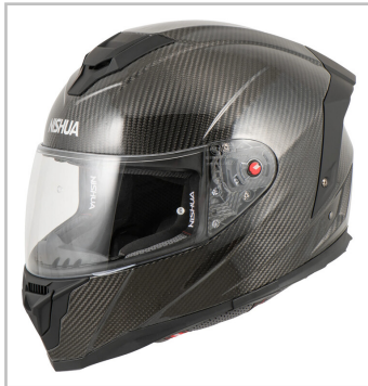
Nishua NRX-3 Carbon.