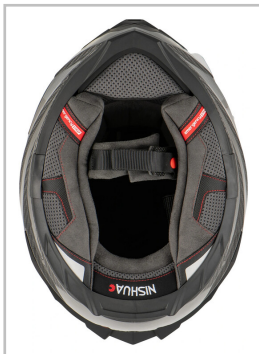
Nishua NRX-3 Carbon.