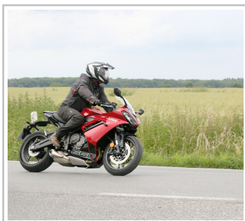
Triumph Daytona 660.