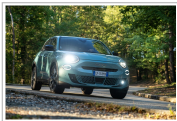
Fiat 600 Hybrid „125 Jahre Edition“.