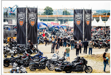
Harley Days Dresden.