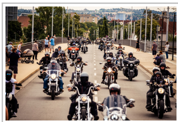
Harley Days Dresden.