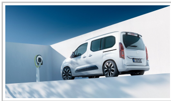
Opel Combo Electric.