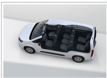
Opel Combo Electric.