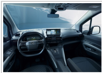
Opel Combo Electric.