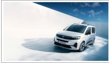
Opel Combo Electric.