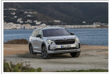
Skoda Kodiaq Sportline.