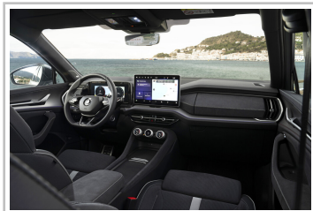
Skoda Kodiaq Sportline.