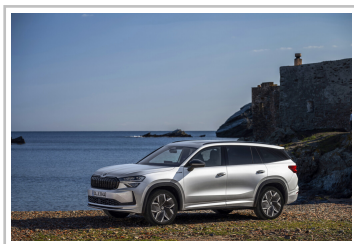
Skoda Kodiaq Sportline.