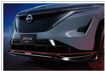
Nissan Ariya Nismo.