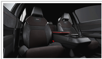
Nissan Ariya Nismo.