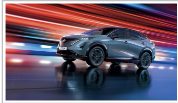
Nissan Ariya Nismo.