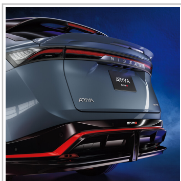
Nissan Ariya Nismo.