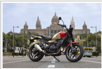
Royal Enfield Guerrilla 450.