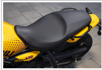
Royal Enfield Guerrilla 450.