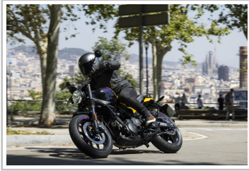
Royal Enfield Guerrilla 450.