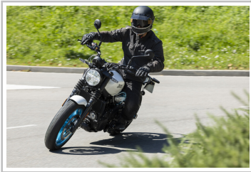
Royal Enfield Guerrilla 450.