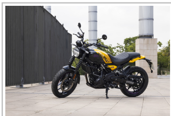
Royal Enfield Guerrilla 450.