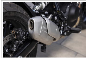
Royal Enfield Guerrilla 450.