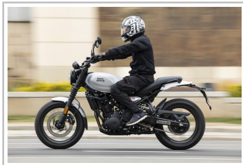
Royal Enfield Guerrilla 450.