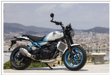
Royal Enfield Guerrilla 450.