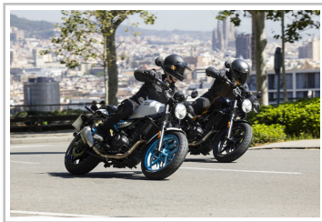
Royal Enfield Guerrilla 450.