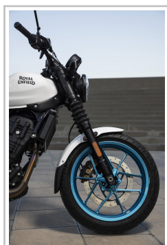
Royal Enfield Guerrilla 450.