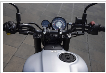
Royal Enfield Guerrilla 450.