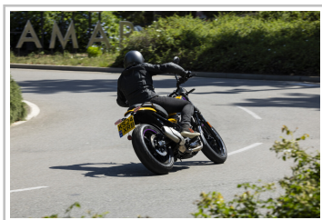
Royal Enfield Guerrilla 450.