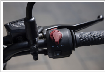
Royal Enfield Guerrilla 450.