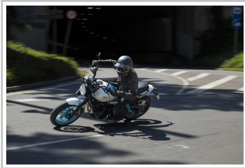
Royal Enfield Guerrilla 450.