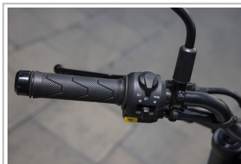
Royal Enfield Guerrilla 450.