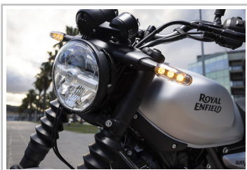
Royal Enfield Guerrilla 450.