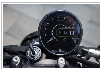
Royal Enfield Guerrilla 450.