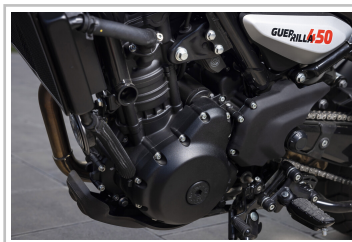
Royal Enfield Guerrilla 450.