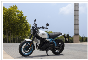
Royal Enfield Guerrilla 450.