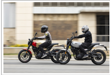
Royal Enfield Guerrilla 450.