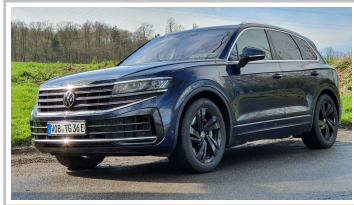
VW Touareg e-Hybrid.