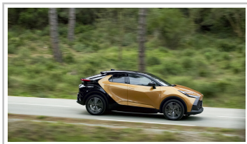
Toyota C-HR PHEV.