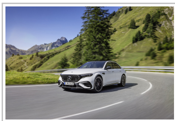
Mercedes-AMG E 53 Hybrid.