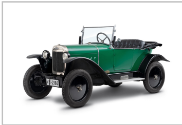
Opel 4/12 PS „Laubfrosch“ (1924).