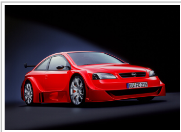
Supersportwagen-Studie: Opel Astra OPC X-Treme (2001).