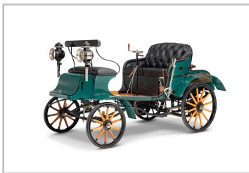
Opel Patent-Motorwagen System Lutzmann (1899).