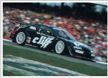
Tourenwagen-Weltmeisterauto 1996: Opel Calibra Cliff.