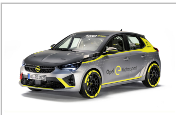
Opel Corsa-e Rally Concept (2019).