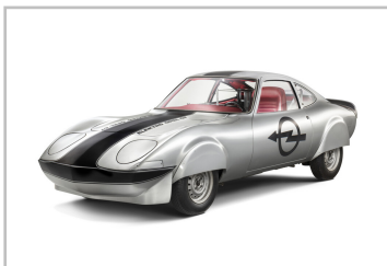
Opel Elektro GT (1971).