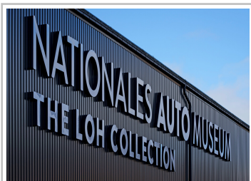
Nationales Automuseum The Loh Collection.