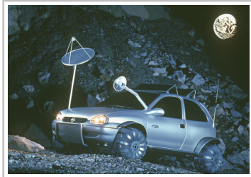
Designstudie Opel Corsa Moon (1997).