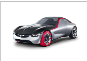
Opel GT Concept (2016).