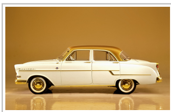
Der zweimillionste Opel, ein 1956er Kapitän A.