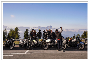
European Bike Week.