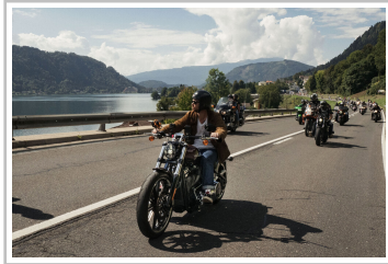
European Bike Week.