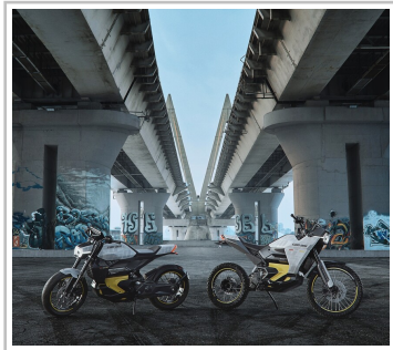
Can-Am Pulse (l.) und Origin.