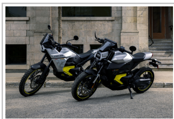
Can-Am Origin und Pulse (v.l.).