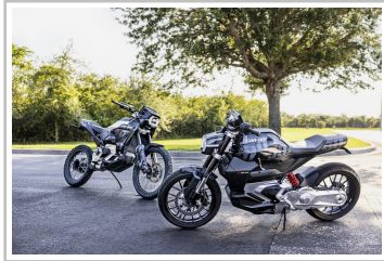
Can-Am Origin und Pulse (v.l.).