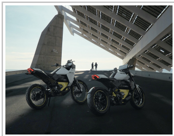
Can-Am Origin und Pulse (r.).