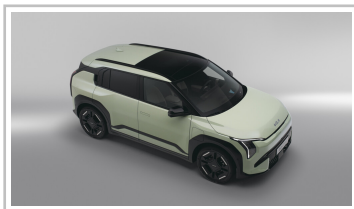
Kia EV3 GT-line.