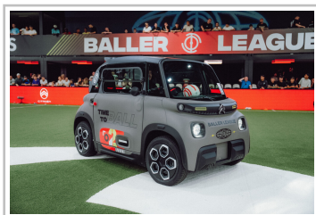
Citroën unterstützt die Baller League.