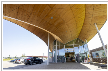
Rastanlage Fürholzen an der A9, Bayern.