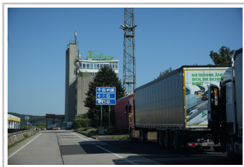
Rastanlage Eisenach Nord an der A4 in Thüringen.