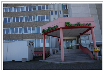
Rastanlage Eisenach Nord an der A4 in Thüringen.