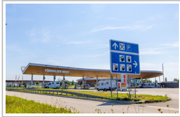
Rastanlage Fürholzen an der A9, Bayern.