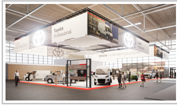
Toyotas Messestand auf der IAA Transportation 2024.