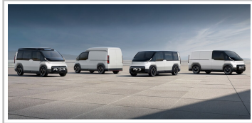
Kia PBV-Studien für die IAA Transportation 2024.