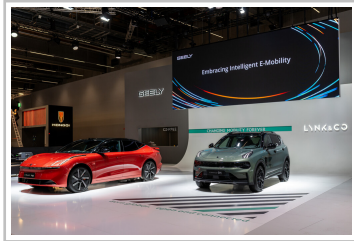
Lynk & Co