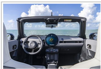
Mini Cooper Cabrio.