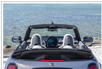
Mini Cooper Cabrio.