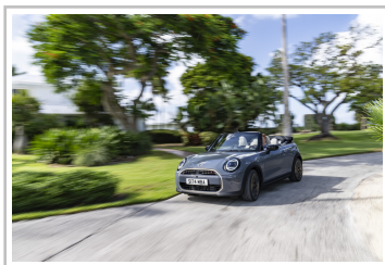
Mini Cooper Cabrio.