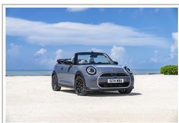
Mini Cooper Cabrio.