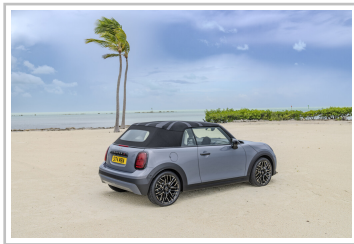
Mini Cooper Cabrio.