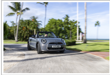
Mini Cooper Cabrio.