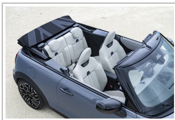
Mini Cooper Cabrio.