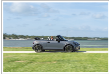
Mini Cooper Cabrio.