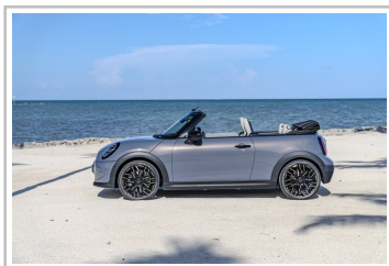
Mini Cooper Cabrio.