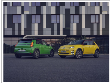
Renault 5 E-Tech Electric.