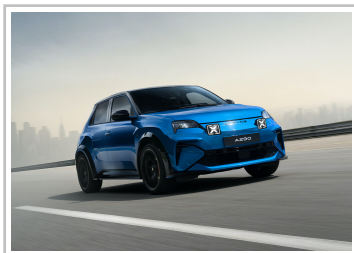
Alpine A290 GTS Vision Blue.