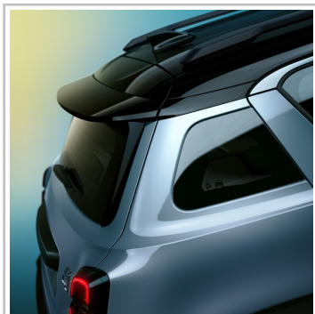
Renault 4 E-Tech.