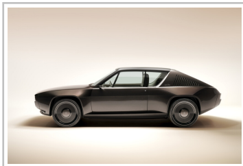
Showcar R17 electric restomod x Ora Īto.