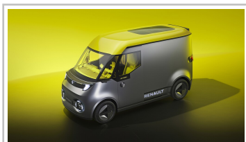
Renault Estafette Concept.