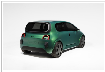
Prototyp Renault Twingo E-Tech Electric.