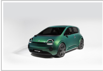
Prototyp Renault Twingo E-Tech Electric.