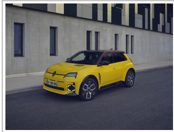
Renault 5 E-Tech Electric.