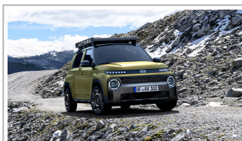
Hyundai Inster Cross.