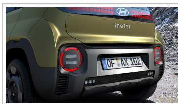
Hyundai Inster Cross.