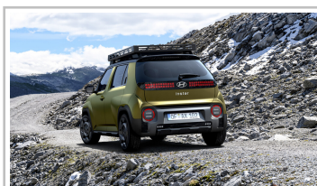
Hyundai Inster Cross.