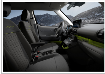
Hyundai Inster Cross.