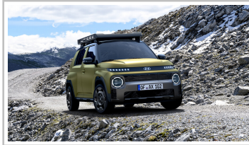
Hyundai Inster Cross.