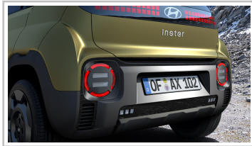
Hyundai Inster Cross.