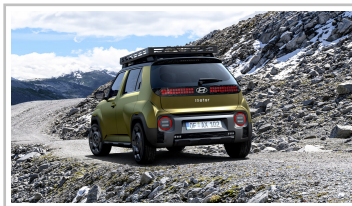
Hyundai Inster Cross.